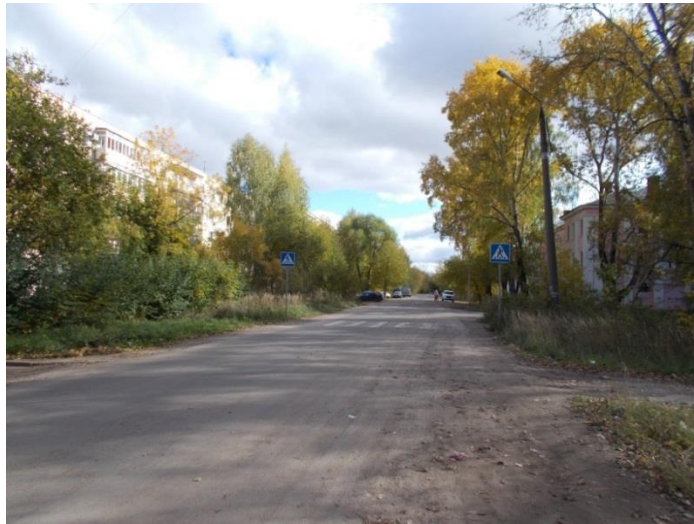
г. Кинешма, ул. воеводы Федора Боборыкина. Фото 2019 г.

Я люблю читать книги и часто посещаю библиотеку-филиал №5. Мой путь проходит по нескольким улицам, и только одна из них носит имя знаменитого земляка-кинешемца, оставившего свой след в истории нашего города Кинешма. Этим человеком был местный воевода Федор Васильевич Боборыкин.