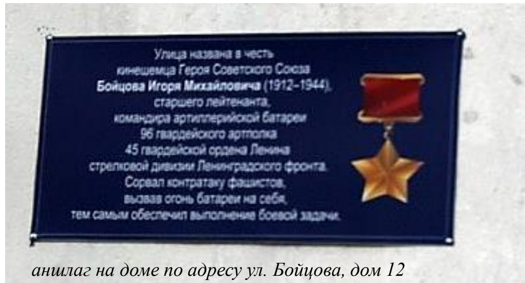
анилаг на доме по адресу ул. Бойцова, дом 12

Когда я иду по ней, я обращаю внимание на мемориальную доску, которая висит на одном из многоквартирных домов. В это время я вспоминаю кинешемца Игоря Михайловича Бойцова и его героический подвиг.