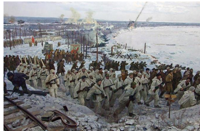
«Прорыв блокады Ленинграда». Фрагмент диорамы.