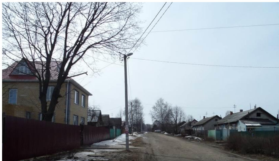
Город Кинешма. Улица Игоря Бойцова.

Я очень люблю читать, но так как домашняя библиотека у меня маленькая, я хожу в библиотеку – филиал №5, которая расположена в нашем районе, недалеко от моего дома. Дорога до библиотеки не долгая, но весьма интересная. А примечательна она одной улицей, названной в честь Героя Советского Союза, кинешемца Игоря Бойцова. В 1987 году старые улицы нашего микрорайона «Красная Ветка» стали переименовывать в честь увековечения памяти людей, героически сражавшихся в годы Великой Отечественной войны. Поэтому улица Рыбинская и стала носить новое имя.