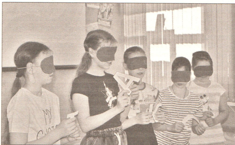
В одном из испытаний участникам с завязанными глазами предстояло ответить на вопросы, складывая слова из бумажных букв

(Представителям от каждой команды по очереди завязывают глаза. Им нужно пройти «по лабиринту», не задев ни одной кегли или кубика. Как вариант, «лабиринт» можно нарисовать на полу мелом. Остальные игроки подсказывают участникам, куда идти.)