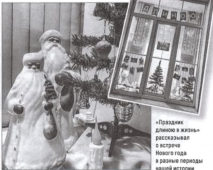
«Праздник длиною в жизнь» рассказывал о встрече Нового года в разные периоды нашей истории

► Интересная тема. Экспозиция привлекла внимание как взрослых, так и детей, потому что рассказывала не только о Новом годе, но и о том, как любимый всеми праздник менялся с течением времени. Старшие вспоминали о ёлочных игрушках, которые у них были в детстве, а ребята увидели, чем восхищались когда-то их родители, бабушки и дедушки. Так близкая всем тема стала связующим звеном между поколениями.