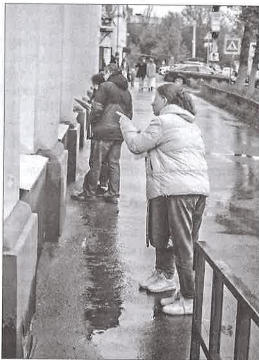
◀ «Окна нашего детства». Как жили люди полвека назад? Желающим предлагалось поучаствовать в квесте и ответить на вопросы о быте, музыке и фильмах того времени

Уже традиционно 14 февраля, в Международный день книгодарения, мы предлагаем всем желающим зайти в Молодёжный центр