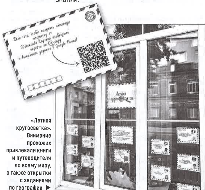
«Летняя кругосветка». Внимание прохожих привлекали книги и путеводители по всему миру, а также открытки с заданиями по географии ▶

Она рассказывала о жизни людей в 80-е гг. прошлого века и представляла собой серию окон, на стёклах которых были изображены предметы, характерные для той эпохи. Посетителям предлагалось принять участие в квесте и ответить на вопросы о быте, музыке и фильмах далёкого десятилетия. За правильные версии участники получали