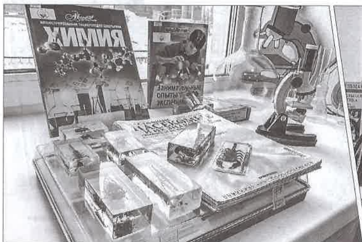
«Мысль. Опыт. Наука». По предметному ряду можно угадать, каким именно дисциплинам посвящена экспозиция – точным, естественным или гуманитарным